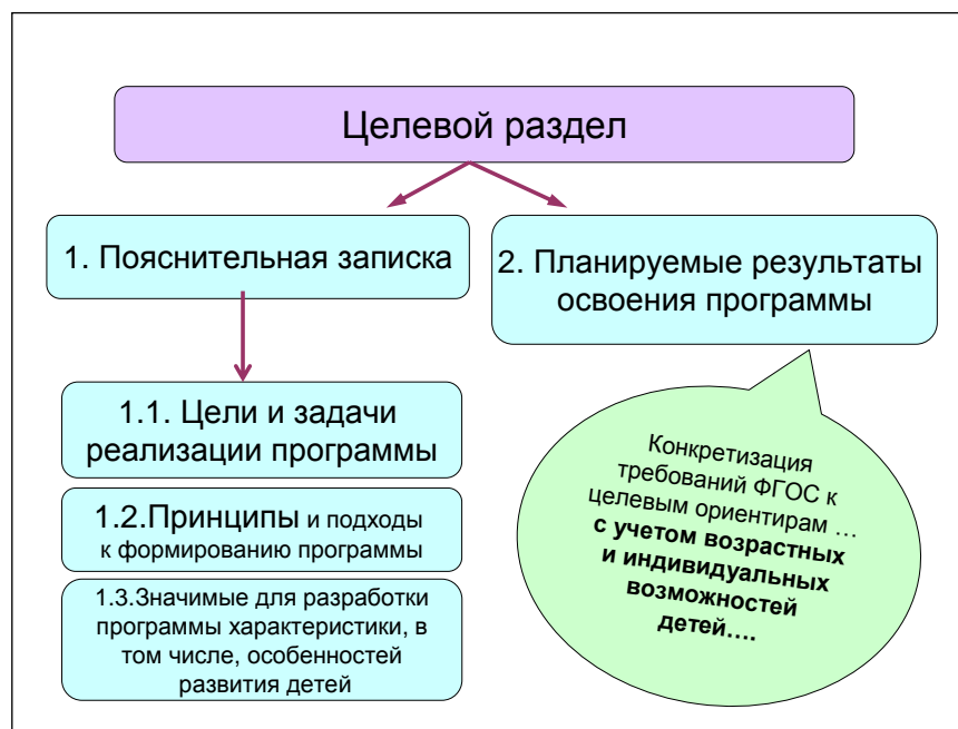
Схема 1. Структура целевого раздела Программы.

Начинать проектирование целевого раздела основной образовательной программы дошкольного образования целесообразно «с конца» — с уточнения планируемых результатов ее освоения ребенком , установления их соответствия Федеральному государственному образовательному стандарту. Ориентиром для разработчиков программы являются планируемые результаты освоения Программы, представленные в ФГОС и в тексте примерной программы.