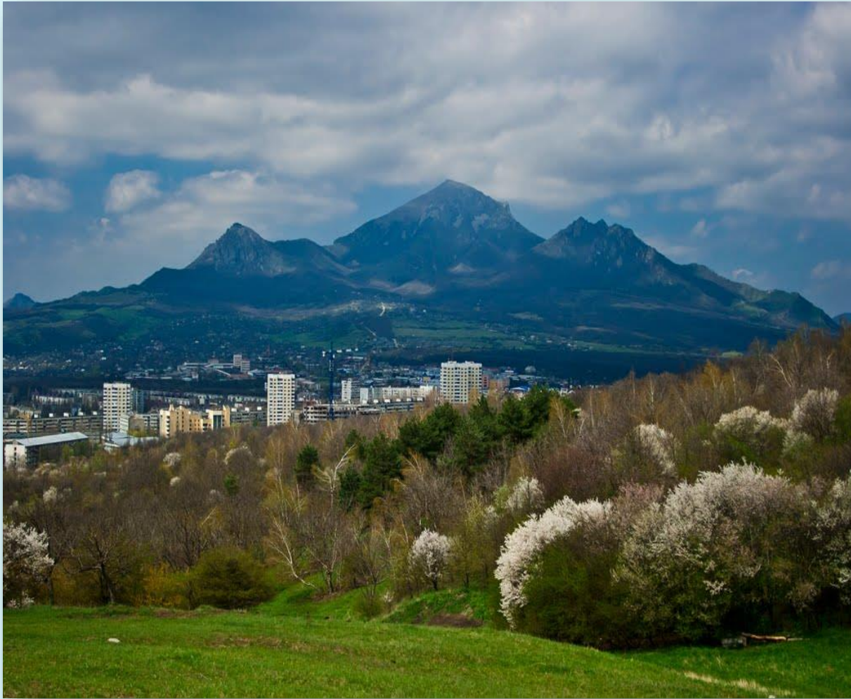
г. Бештау – 1401м.

Ставропольские вулканы расположились к северу от Эльбруса, образовав целый вулканический район, называемый обычно Пятигорьем, хотя здесь не пять, а семнадцать вулканических гор..,