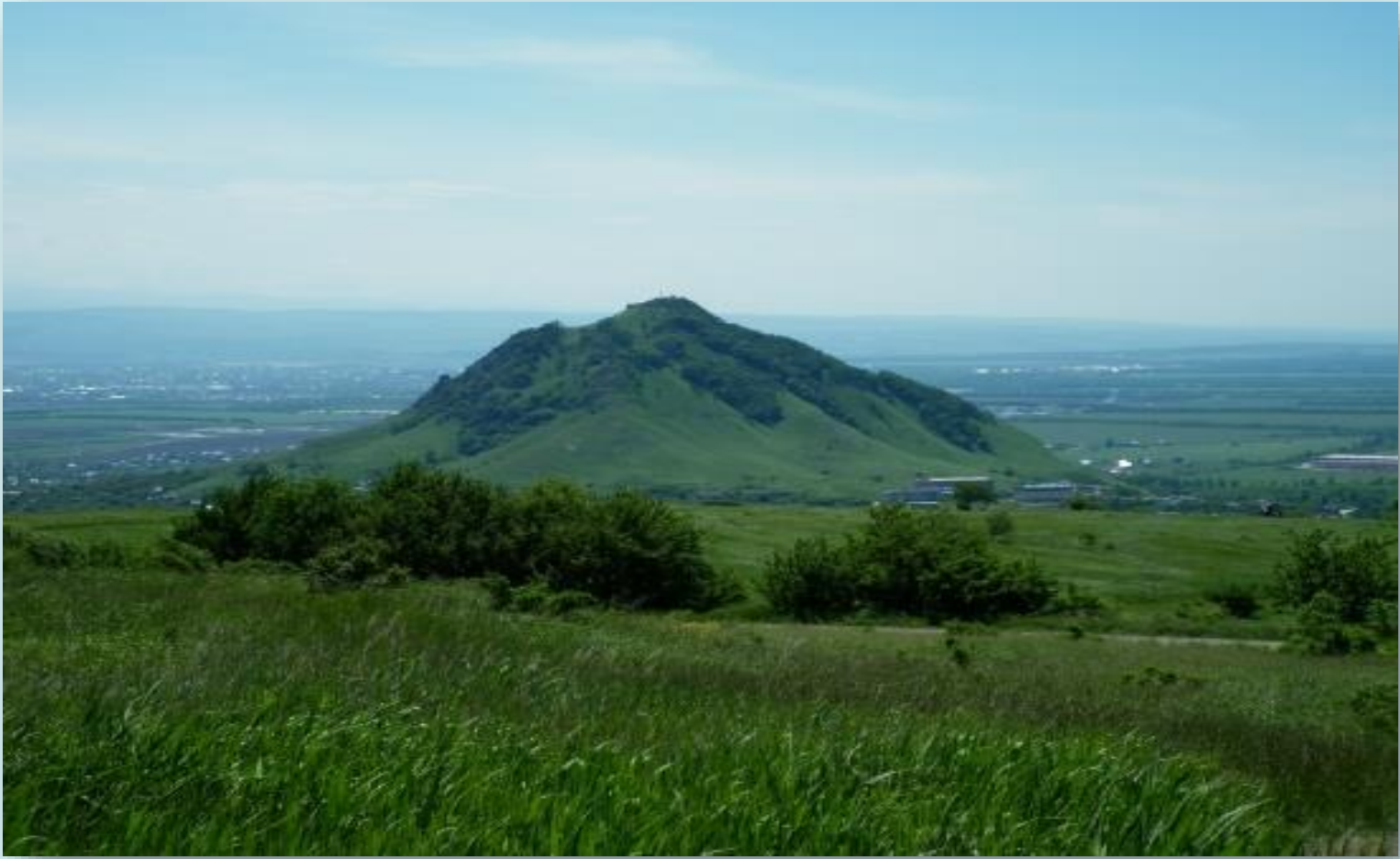
Гора Шелудивая – 874 м., Лермонтов