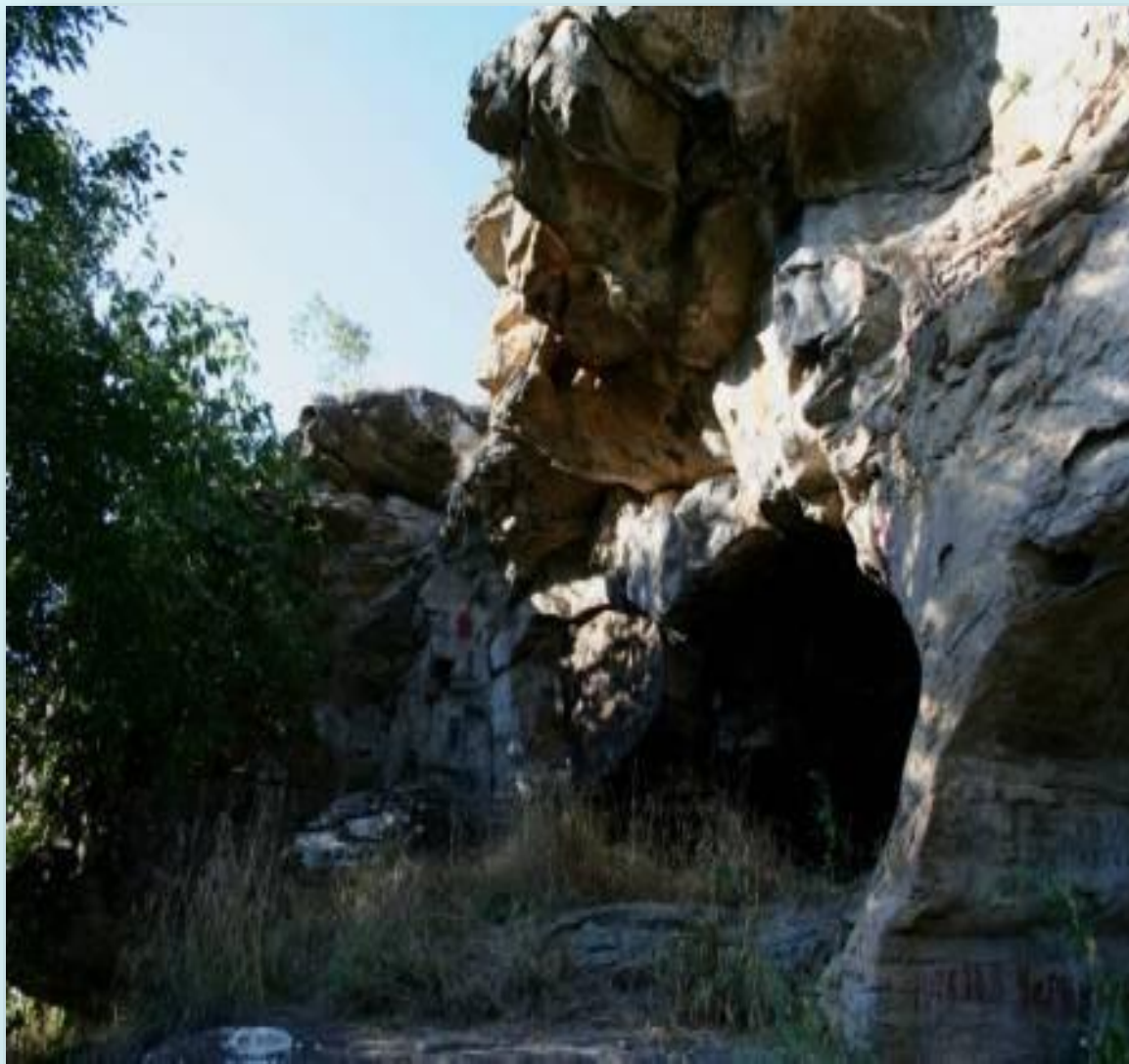
Пещеры «Каменные сараи»

На трассе Ставрополь – Минеральные Воды на р. Томузловка расположено село Александровское.