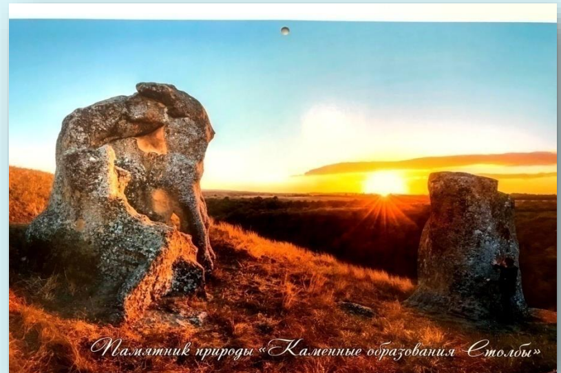
Памятник природы «Каменные образования Столбы»