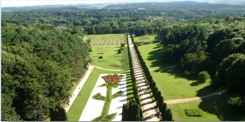
Национальный парк «Кисловодский»

В Ставропольском крае находится 41 заказник, 66 памятников природы, 1 национальный парк.