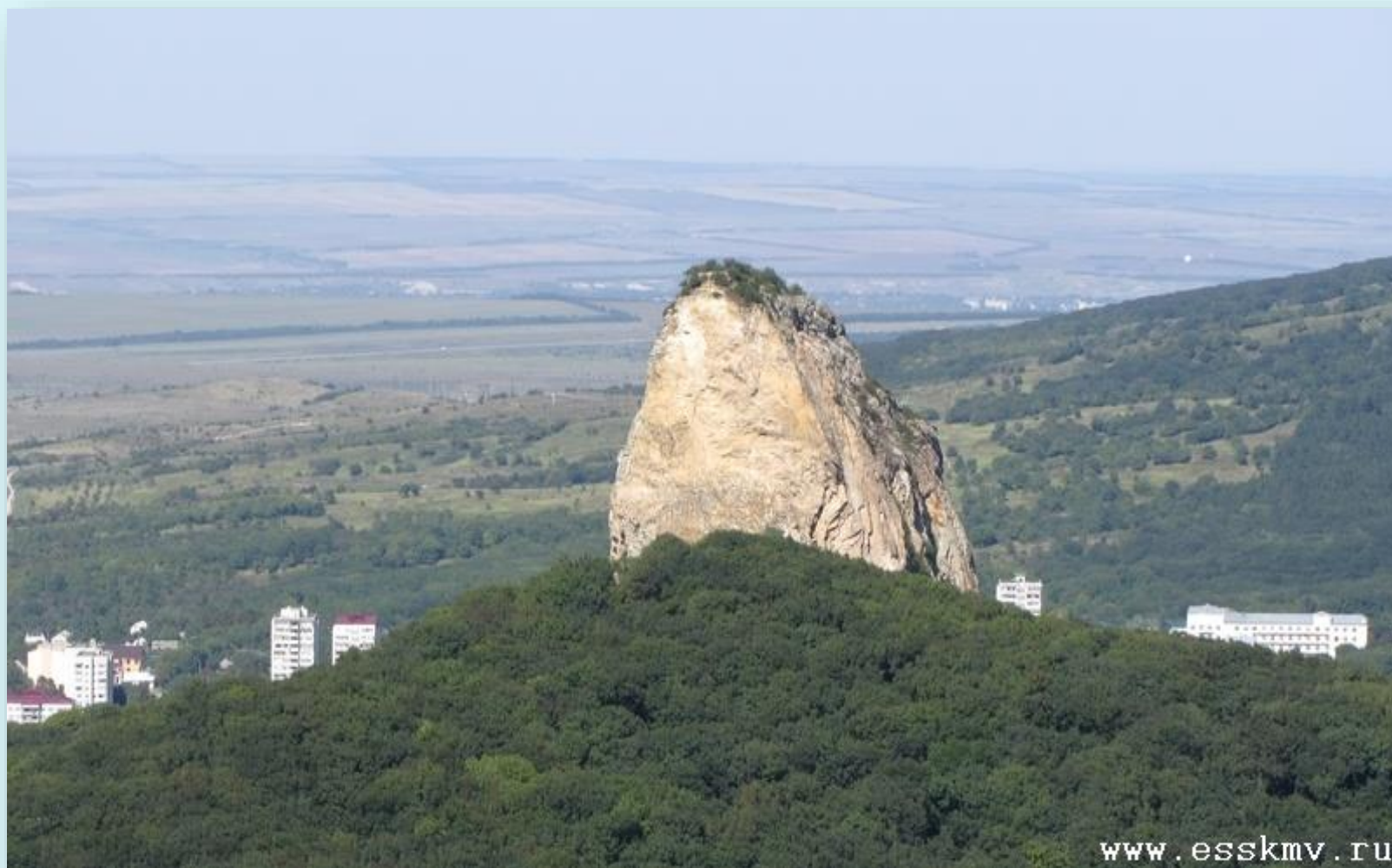
Гора Медовая – 725 м. г. Железноводск