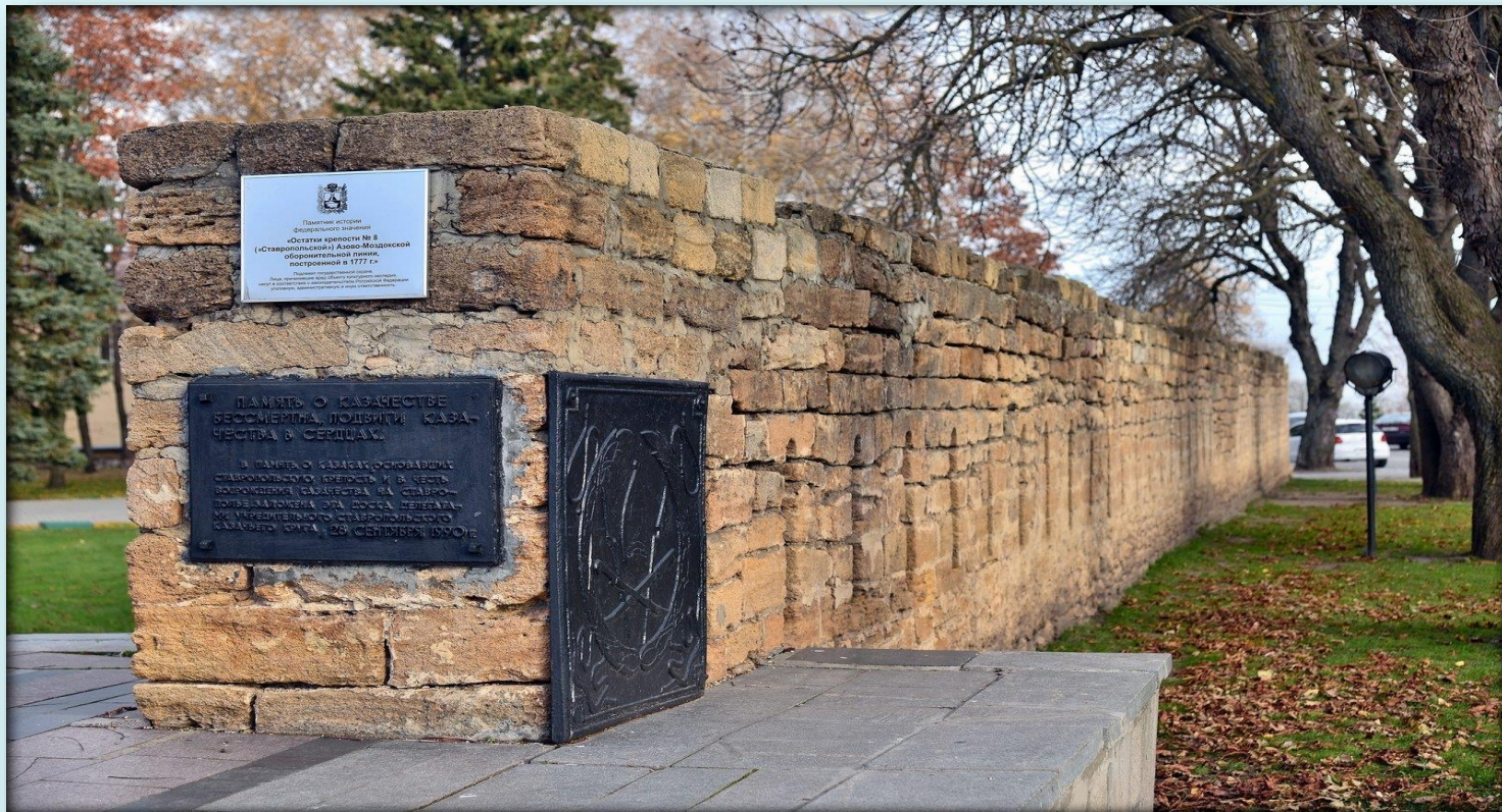
Крепостная стена Ставрополь

Ставропольская крепость была построена на реке Ташла в 1777 году наряду с девятью крепостями, вошедшими в Азово – Моздокскую оборонительную линию, для защиты южных границ России.