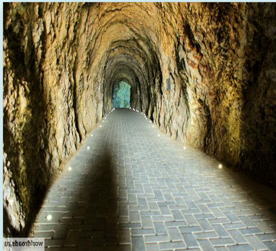
Тоннель в Провал