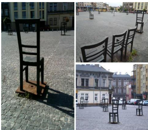
Краков, Польша. «Стул за 1000 евреев» - памятник жертвам гетто в районе Подгорже.