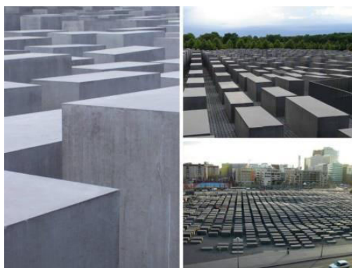
Берлин (Германия). «Плиты, плиты» - памятник жертвам Холокоста.