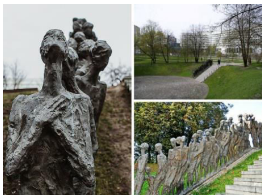
Рига (Латвия) Мемориал «Лес»

Самые известные памятники жертвам Холокоста в мире