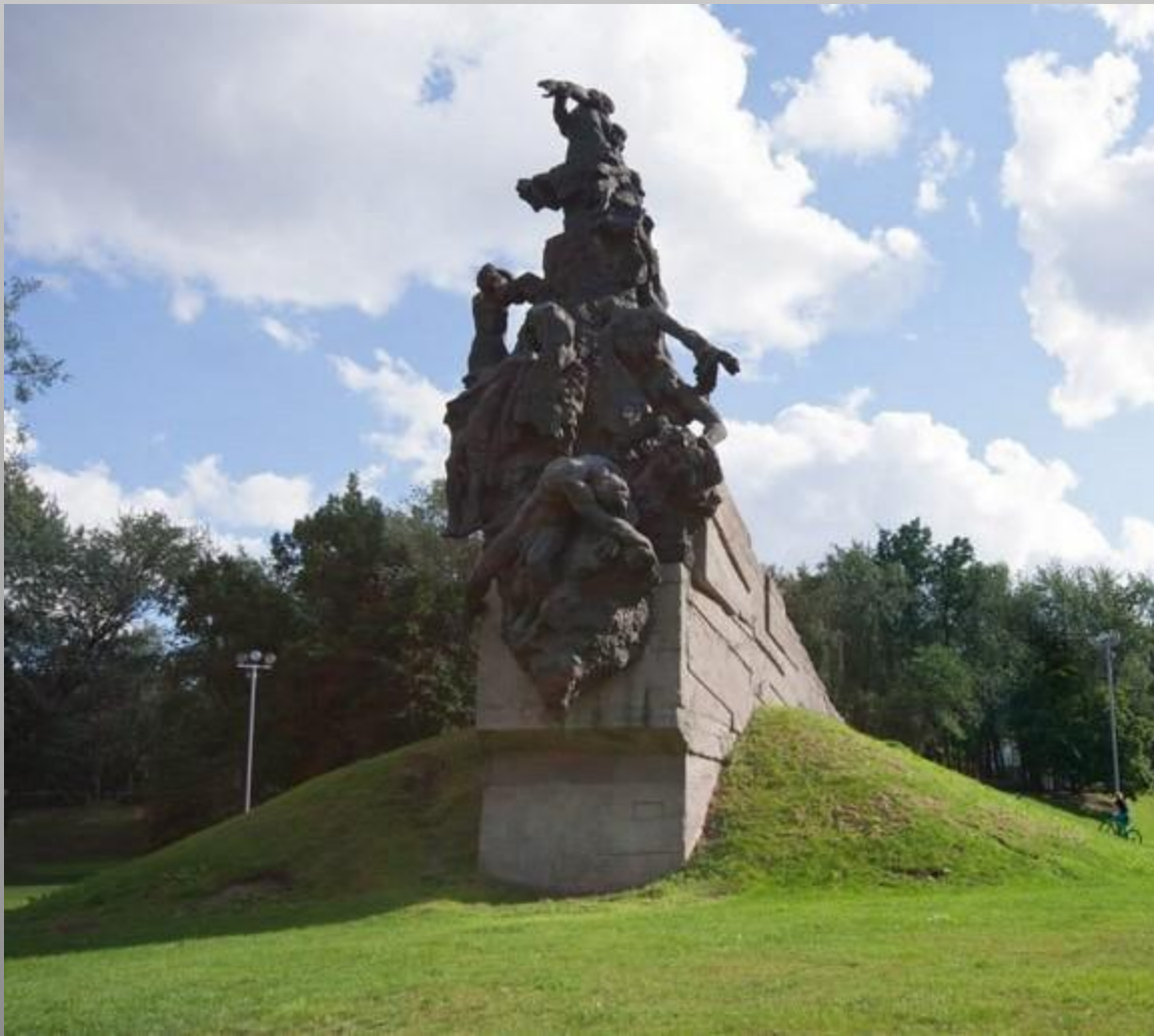
Мемориалы в Бабьем Яру