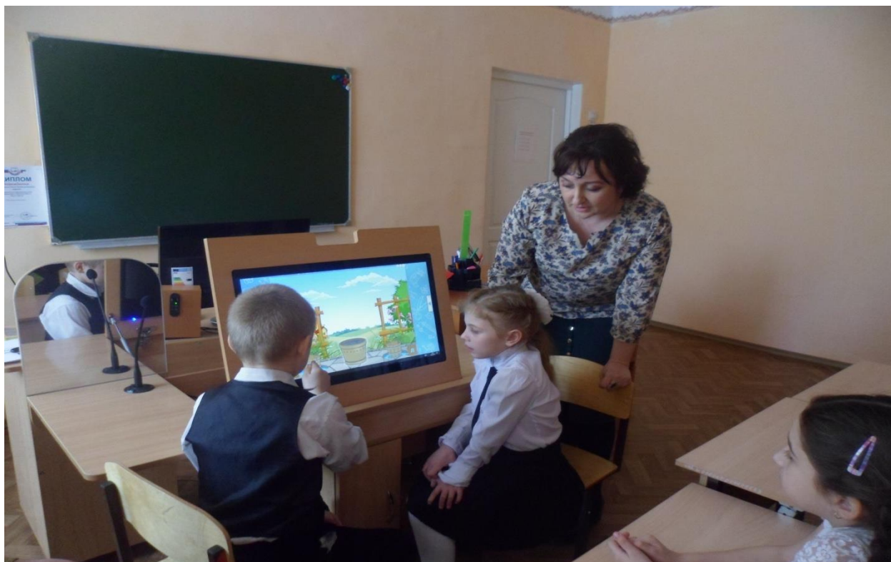
Применение инновационных технологий и использование элементов театральной деятельности.