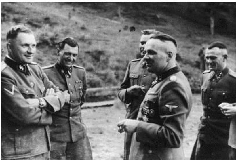
(Рихард Баер (комендант лагеря в 1944 году), неизвестная персона, лагерный врач Йозеф Менгеле, комендант лагеря Биркенау Йозеф Крамер)

Третья группа, в основном близнецы и карлики, люди с физическими отклонениями и особенностями отправлялись на различные медицинские эксперименты, в частности к доктору Йозефу Менгеле, известному под прозвищем «ангел смерти».