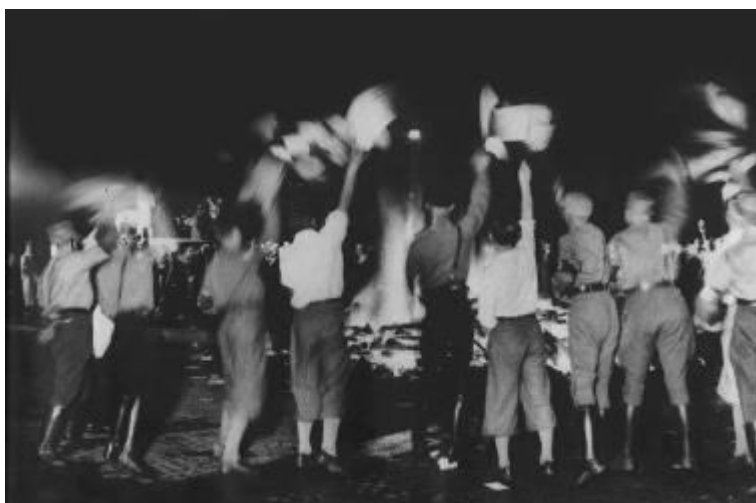
Берлин, 10 мая 1933 г. Студенты университета сжигают книги еврейских и других «запрещенных» авторов.

По мере углубления сегрегации евреев начали изменяться и настроения в обществе: большинство немцев либо поддержали попытки правительства очистить Германию от евреев, либо остались к ним безразличными. К началу депортации немецких евреев в 1940 г. контакты между ними и их согражданами были разорваны практически полностью. В сентябре 1941 г. уже совершившаяся сегрегация была закреплена символически: евреям было приказано нашить на одежду желтую «Звезду Давида». 8