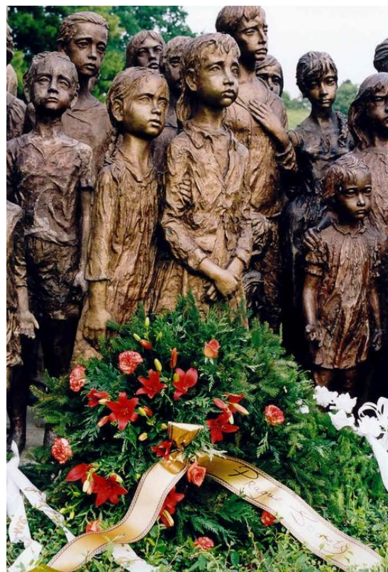
Памятник 82 уничтоженным детям в Лидице