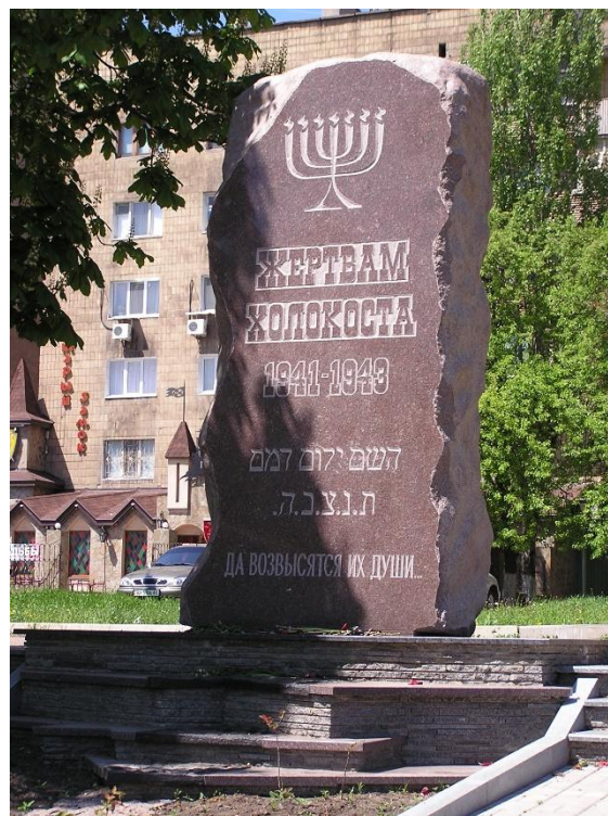
Памятник жертвам Холокоста в Донецке