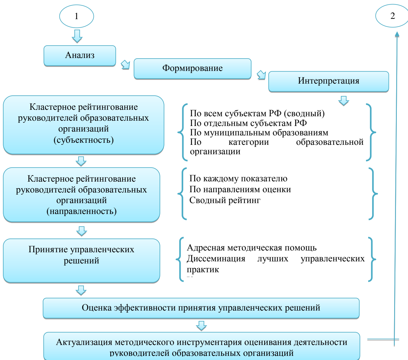
Рис. 2. Модель оценивания руководителей образовательных организаций на основе системы управленческих компетенций