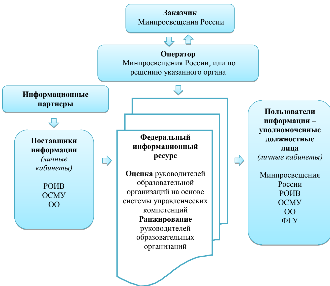
Рис. 1. Механизм функционирования федерального информационного ресурса

5) пользователей информации – уполномоченных должностных лиц федерального органа исполнительной власти, осуществляющего функции по выработке и реализации государственной политики и нормативно-правовому регулированию в сфере общего образования, органов исполнительной власти субъектов Российской Федерации, органов местного самоуправления, осуществляющих управление в сфере образования, организаций, реализующих образовательные программы общего образования, а также должностных лиц организации, подведомственной указанному федеральному органу исполнительной власти и уполномоченной им на ведение федерального информационного ресурса.