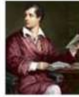
Джордж Гордон Байрон