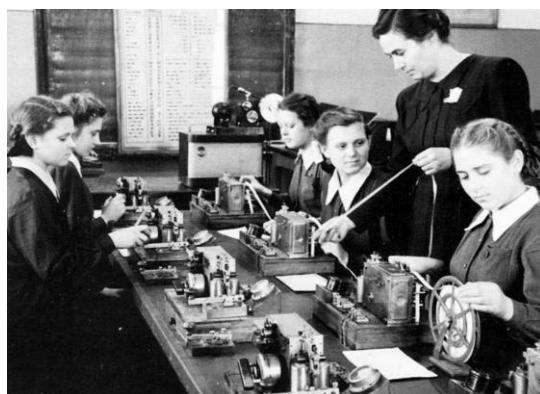
Фабрично-заводское училище СССР

В современной России система среднего профессионального образования заняла прочное положение в образовательном комплексе. Стране, в отличие от 90-х годов XX века, нужны не только юристы и экономисты, но и инженеры, строители, металлурги, те кто владеет информационными технологиями, то есть специалисты-практики.