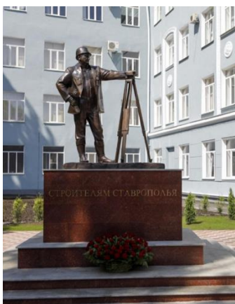
Памятник Строителям Ставрополя

Рядом с главным корпусом Ставропольского строительного техникума в 2019 году был открыт памятник Строителям Ставрополя. Бронзовая скульптура прораба с нивелиром в руках символизирует созидательный труд строителей и служит примером молодому поколению как символ сохранения лучших традиций отрасли. Именно здесь, у памятника, каждую неделю в понедельник под звуки гимна происходит торжественное поднятие Государственного флага Российской Федерации, это право предоставляют лучшим студентам техникума. Им, поколению XXI века, предстоит строить новую Россию, где производительный творческий труд и есть настоящая ценность. И не случайно 25 июля 2022 года Президент Российской Федерации Владимир Владимирович Путин подписал Указ о праздновании Дня среднего профессионального образования. В документе говорится: «В целях развития и популяризации среднего профессионального образования постановляю установить День среднего профессионального образования и отмечать его 2 октября».