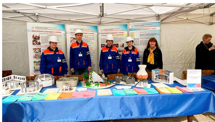
Студенты Ставропольского строительного техникума