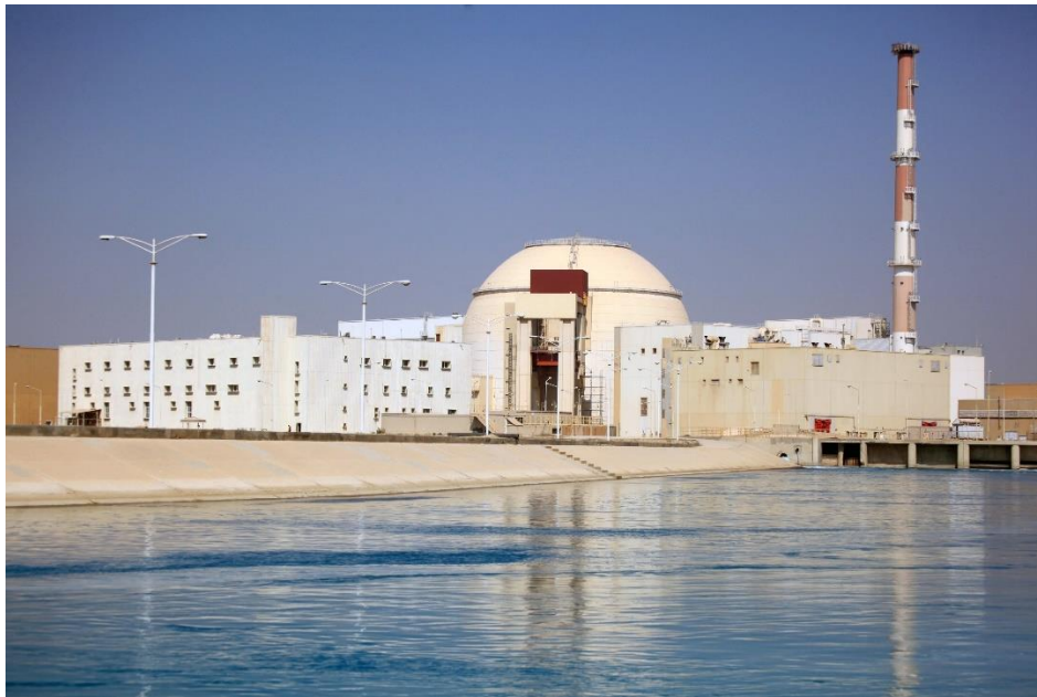
Бушцрская АЭС сегодня