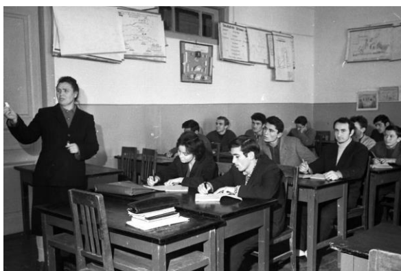
Индустриальный техникум СССР

Техникумы были индустриальными, строительными, транспортными, сельскохозяйственными и других отраслей народного хозяйства. Срок обучения в техникумах составлял 4 года. Среднее специальное педагогическое, музыкальное, медицинское и другие виды среднего специального образования получали в училищах.