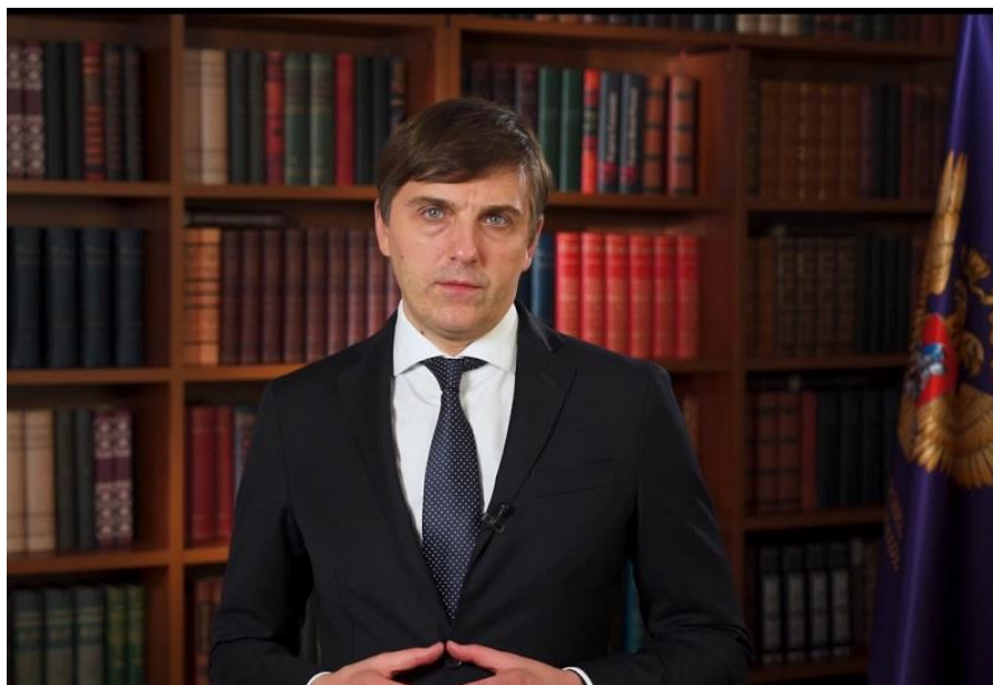
Министр просвещения Российской Федерации Сергей Сергеевич Кравцов

Выбор даты, 2 октября, связан с тем, что именно в этот день в 1940 году был принят указ Президиума Верховного Совета СССР «О государственных трудовых резервах СССР». В нем определялись три типа училищ: ремесленные, железнодорожные училища и школы фабричного заводского обучения.