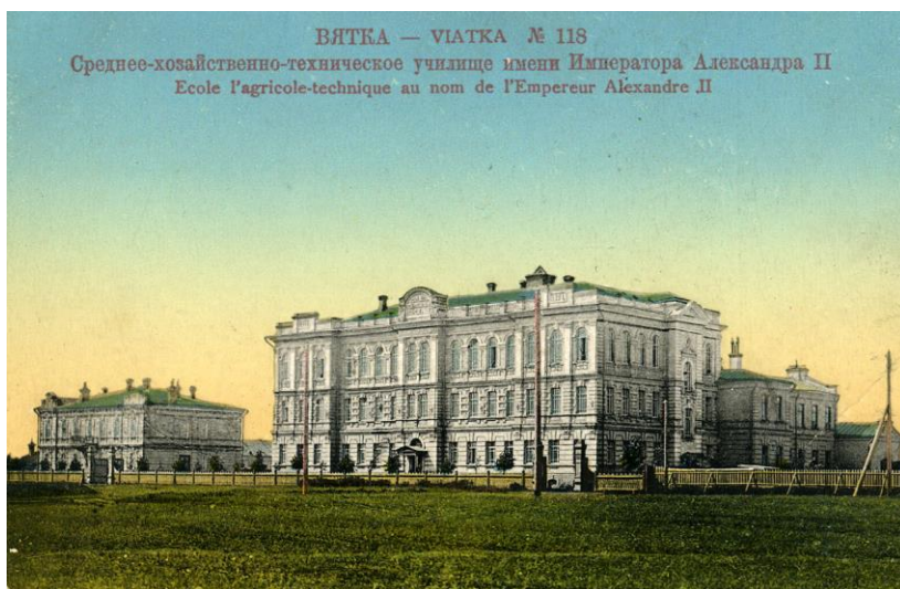
Среднее хозяйственно-техническое училище имени Императора Александра II