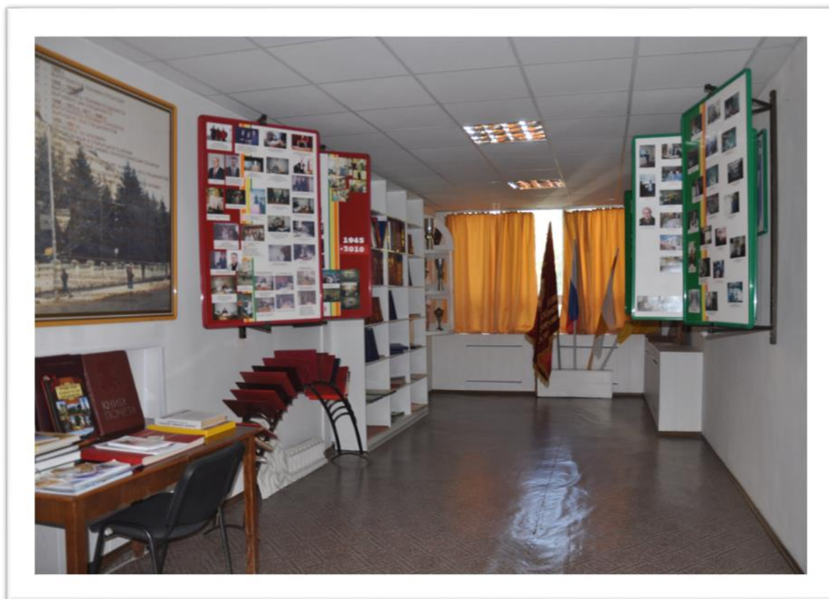
Музей Ставропольского строительного техникума