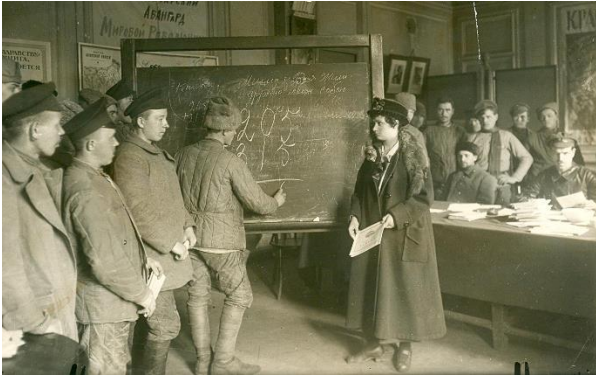
Образование в СССР в 1920-е годы