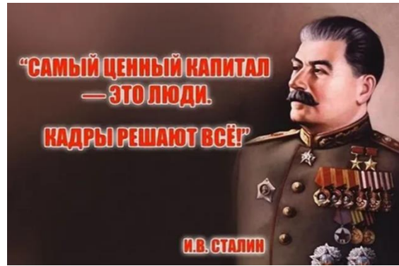
4 мая 1935 год. Речь в Кремлевском дворце