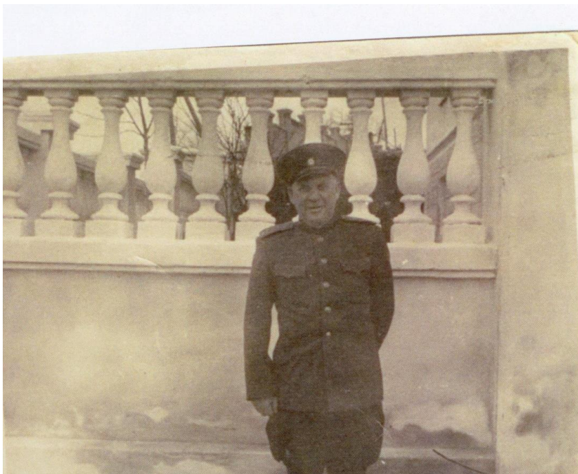
1950-е годы. Город Ставрополь, строительный техникум