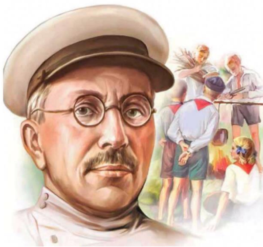
Макаренко Антон Семенович

А.С. Макаренко, в одной из своих статей, так конкретизировал задачу воспитания рабочих: «Мы желаем воспитать культурного советского рабочего. Следовательно, мы должны дать ему образование, желательно среднее, мы должны дать ему квалификацию, мы должны его дисциплинировать, он должен быть политически развитым и преданным