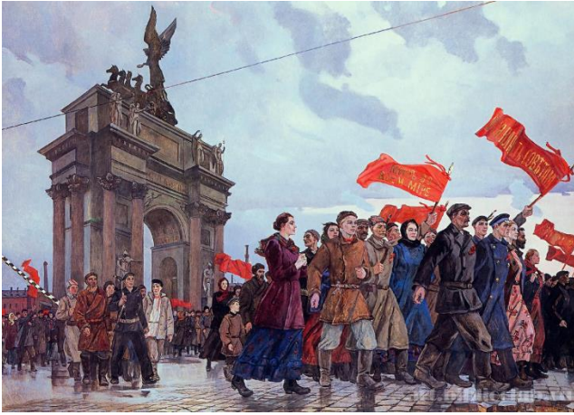
Великая Октябрьская революция 1917 год