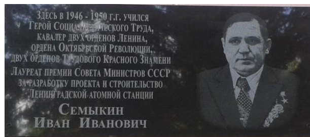
Мемориальная доска И.И. Семькину