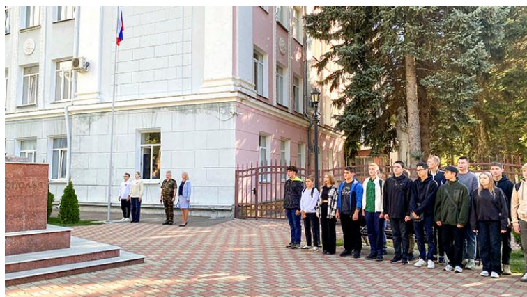
Торжественное поднятие Государственного флага Российской Федерации под звуки гимна