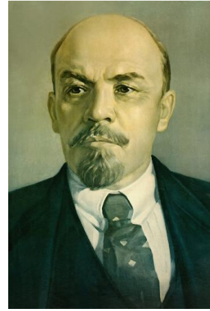
Владимир Ильич Ленин 22.04.1870 – 21.01.1924 гг.

В тяжелейших условиях становления нового государства, голода и разрухи В.И. Ленин не забывал о проблемах образования молодежи и уделял им большое внимание. Из-под его пера вышло 40 Декретов по вопросам, касающимся образования и 20 из них касались именно профессионального образования.