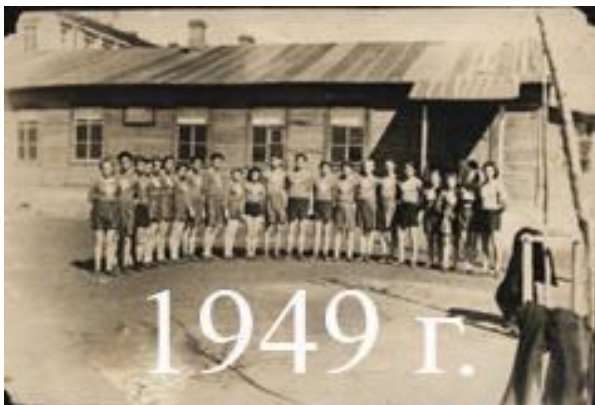
Техникум гражданского строительства

Во исполнение Постановления государственного комитета обороны от 25 марта 1944 года за №5463 и в соответствии с приказом Всесоюзного комитета по делам Высшей школы при Совете Народных Комиссаров СССР от 24 июня 1944 года за №142 и приказа народного комиссара жилищно-