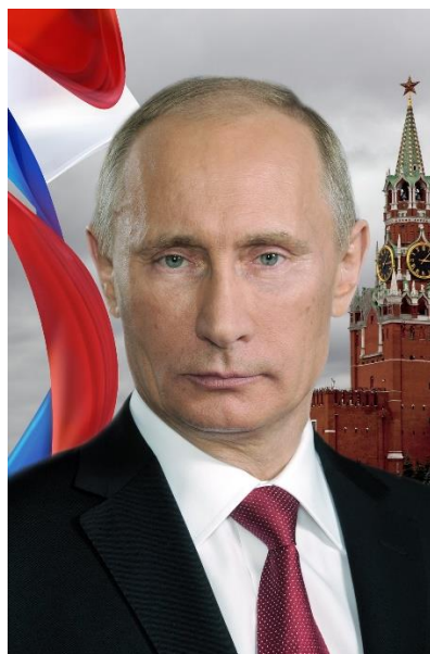
Указ президента РФ о Дне среднего профессионального образования