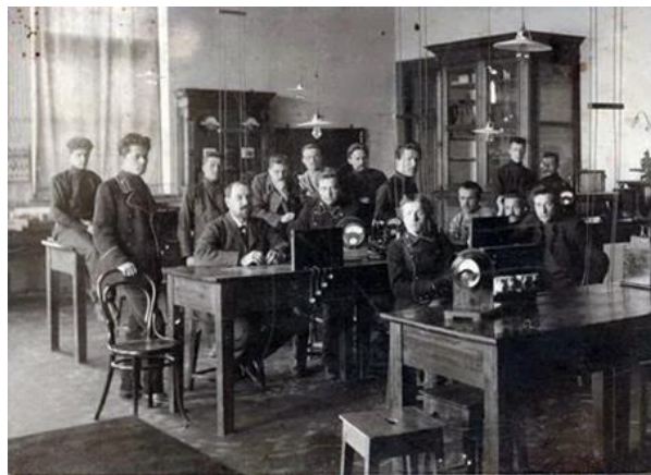
Низшее механико-техническое училище

Октябрьская революция 1917 года изменила коренным образом не только политическую систему России, но и идеологию страны, а значит – просвещение, в том числе и профессиональное образование. 9 ноября 1917 года, буквально через один день после Октябрьского переворота, в Советской России был создан Отдел профессионального образования, который объединил все профессиональные школы, независимо от их форм собственности (ведомственные, государственные и частные), содержания и методов обучения.